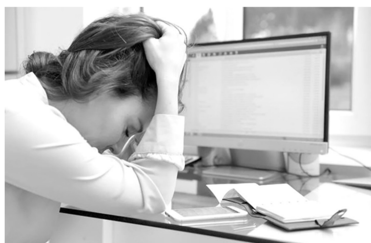
Привязанность к гаджетам также вгоняет в стресс

В современном мире многие из нас плохо живут в состоянии глубокого стресса, даже не подозревая об этом, чтобы вовремя заботиться о себе. У этого тяжелого состояния имеются типичные признаки, по которым можно взглянуть своего «невидимого врага».