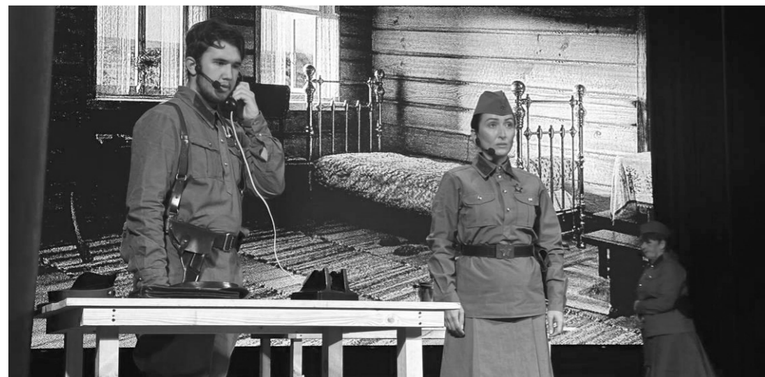
Сцена из спектакля «А зори здесь тихие...»

повесть «А зори здесь тихие...» впервые была опубликована в 1969 году в журнале «Юность». Первоначальный вариант именовался «Всена, которой не было». Однако главный редактор журнала «Юность» Борис Полевой предложил изменить название. Так появилась «А зори здесь тихие...». А в 1972 году на экраны вышел и кинофильм по этой повести.