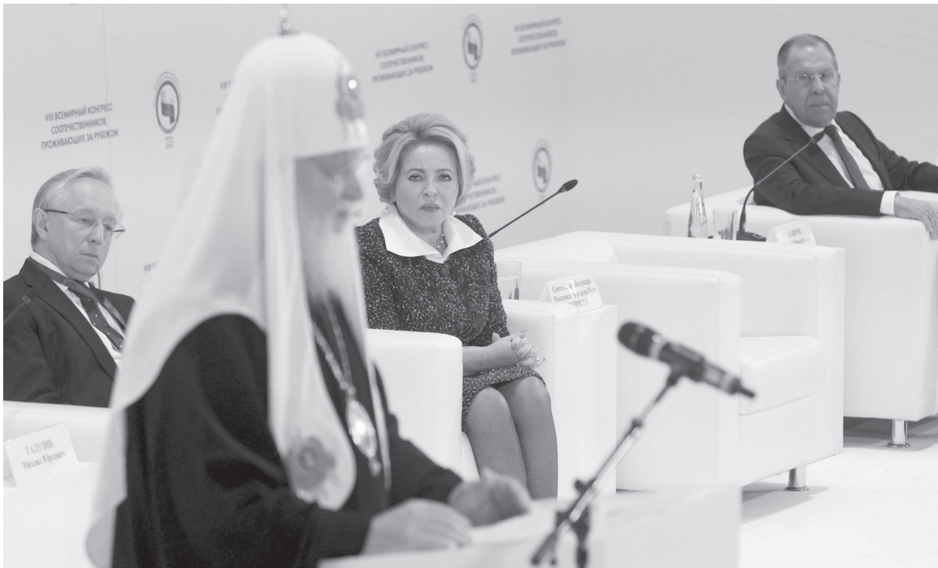
Патриарх Московский и всея Руси Кирилл выступает на пленарной сессии VIII Всемирного конгресса соотечественников, проживающих за рубежом

На пленарной сессии конгресса выступили: председатель Совета Федерации Федерального Собрания Российской Федерации Валентина Матвиенко, заместитель председателя Государственной Думы Федерального Собрания Российской Федерации Анна Кузнецова, патриарх Московский и всея Руси Кирилл, председатель Правительственной комиссии по делам соотечественников за рубежом, министр иностранных дел Российской Федерации Сергей Лавров, руководитель Федерального агентства по делам Содружества Независимых Государств, соотечественников, проживающих за рубежом, и по международному гуманитарному сотрудничеству Евгений Примаков, губернатор Ханты-Мансийского автономного