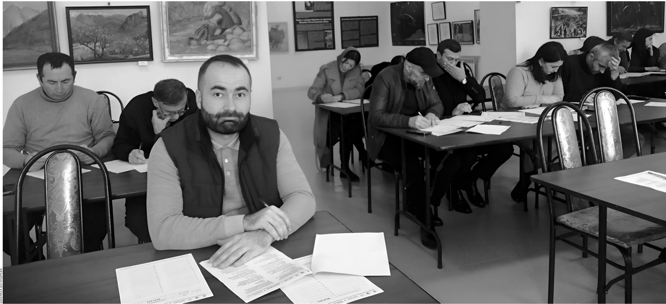
Участники акции пишут Большой этнографический диктант в Картинной галерее в Черкесске

В минувшую среду Карачаево-Черкесия присоединилась к девятой Всероссийской просветительской акции «Большой этнографический диктант»