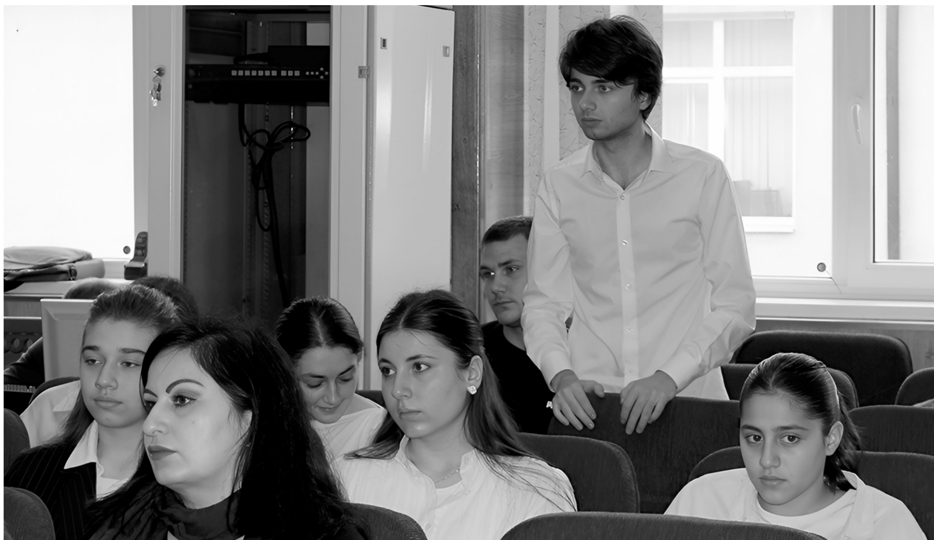
Школьники с интересом слушали выступающих и задавали вопросы

«Одна из важнейших задач Отделения Социального фонда России по КЧР — формировать новую пенсионную культуру населения, особенно у молодежи. Молодым людям важно знать свои пенсионные и социальные права, осознавать еще до начала трудовой деятельности, какие факторы влияют на размер будущей пенсии, в чем опасность зарплаты «в конверте», на какую поддержку отделения фонда они могут рассчитывать в разных жизненных ситуациях. Важно, чтобы каждый с юных